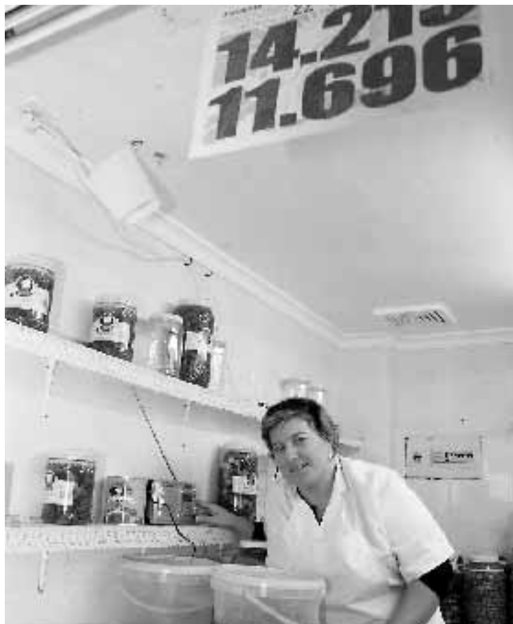
Puesto del Mercado de Cádiz ayer por la mañana.

Esta vez, la suerte se quedó en La Isla. Enhorabuena y a disfrutarlo.