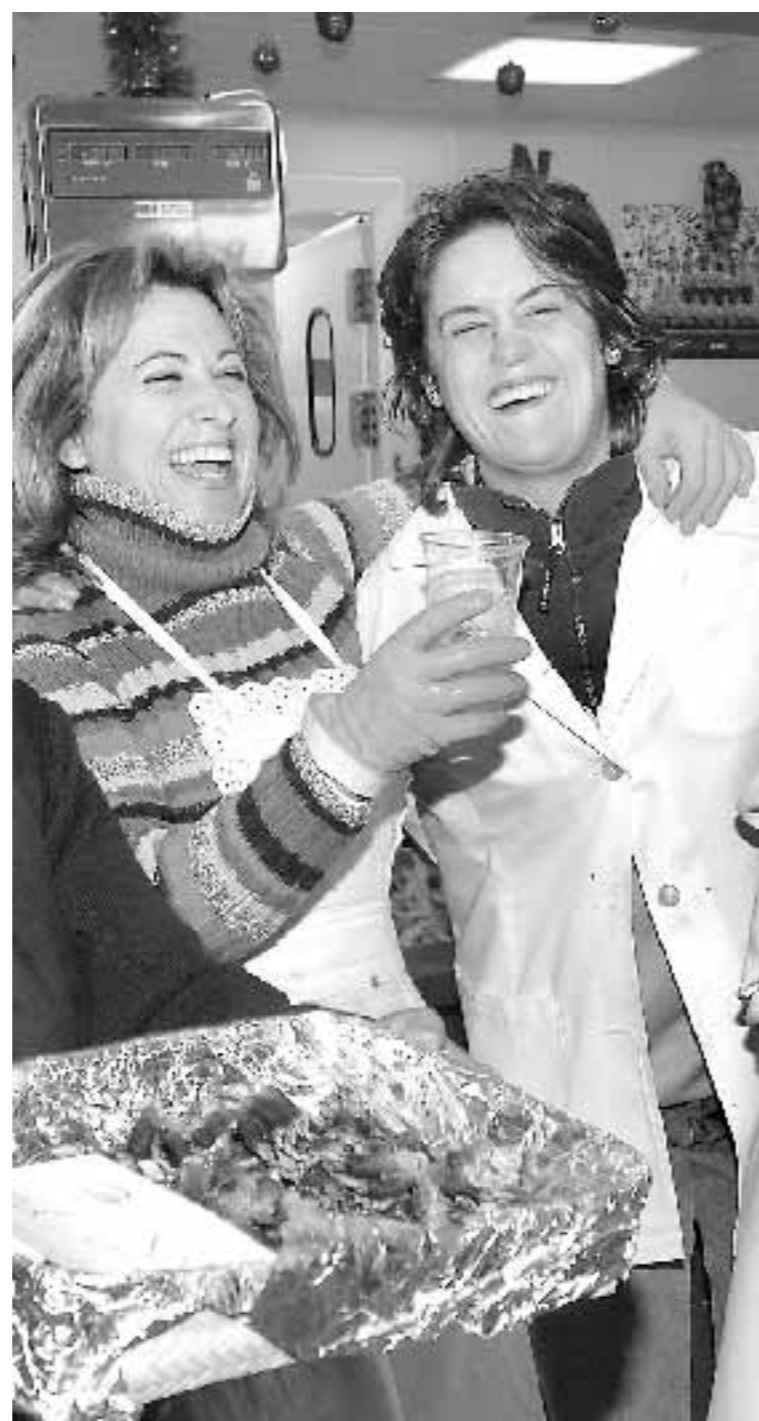
BARACALDO. Pescaderas brindan por su cuarto premio.

Los propietarios de la administración número 9 de Baracaldo, en el cinturón industrial de Bilbao, fueron los primeros sorprendidos por la noticia, ya que repartieron, íntegros, entre sus vecinos, los 30 millones de euros correspondientes a este cuarto premio. El escaso reparto de estas series puede deberse, quizá, a la novedad de los números, ya que en la Lotería navideña la tradición se tiene muy en cuenta en todos los sentidos.