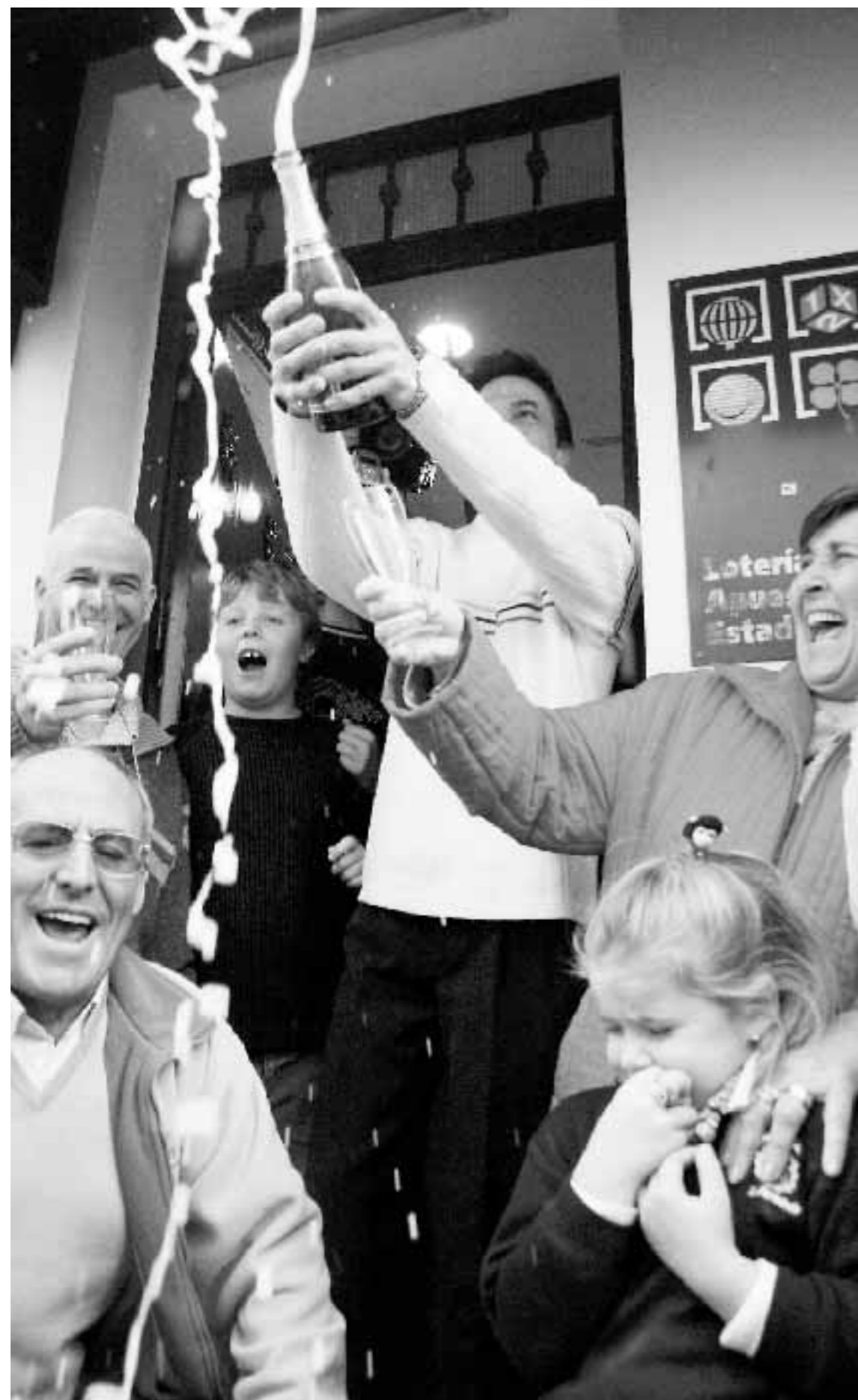
Celebración por todo lo alto en la administración que repartió los décimos premiados.

Camposoto y Buen Pastor se encuentran entre los barrios agraciados