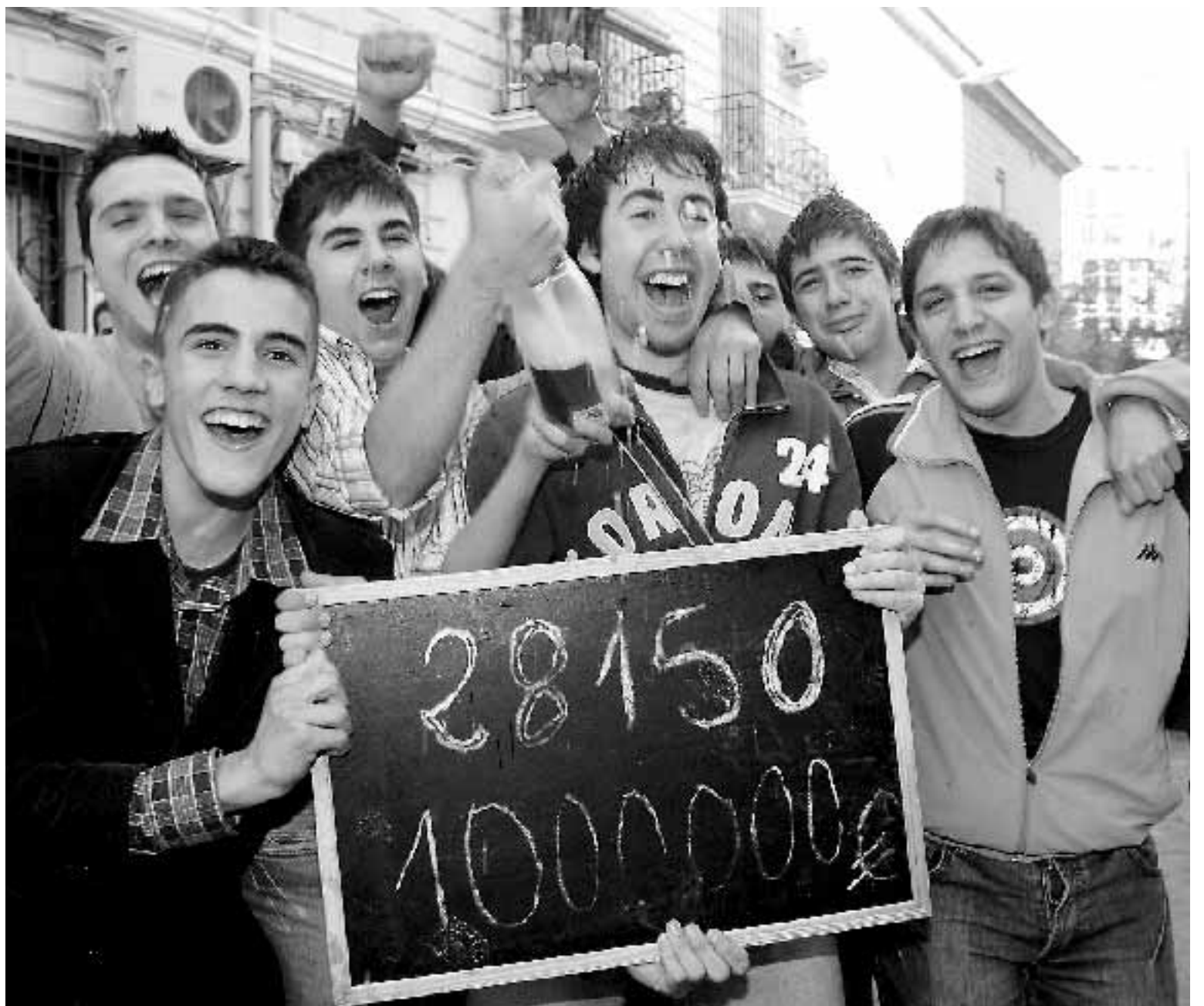
ALEGRÍA DESBORDADA. Miembros de la falla Marqués de Montortal que ha vendido 12.500 papeletas del segundo premio.

El famoso «que la suerte te acompañe» no cayó en saco roto. La Purísima se encuentra a escasos 200 metros del lugar de rodaje, como no dejaron de recordar durante todo el día los cientos de personas que se agolparon eufóricos en sus puertas.