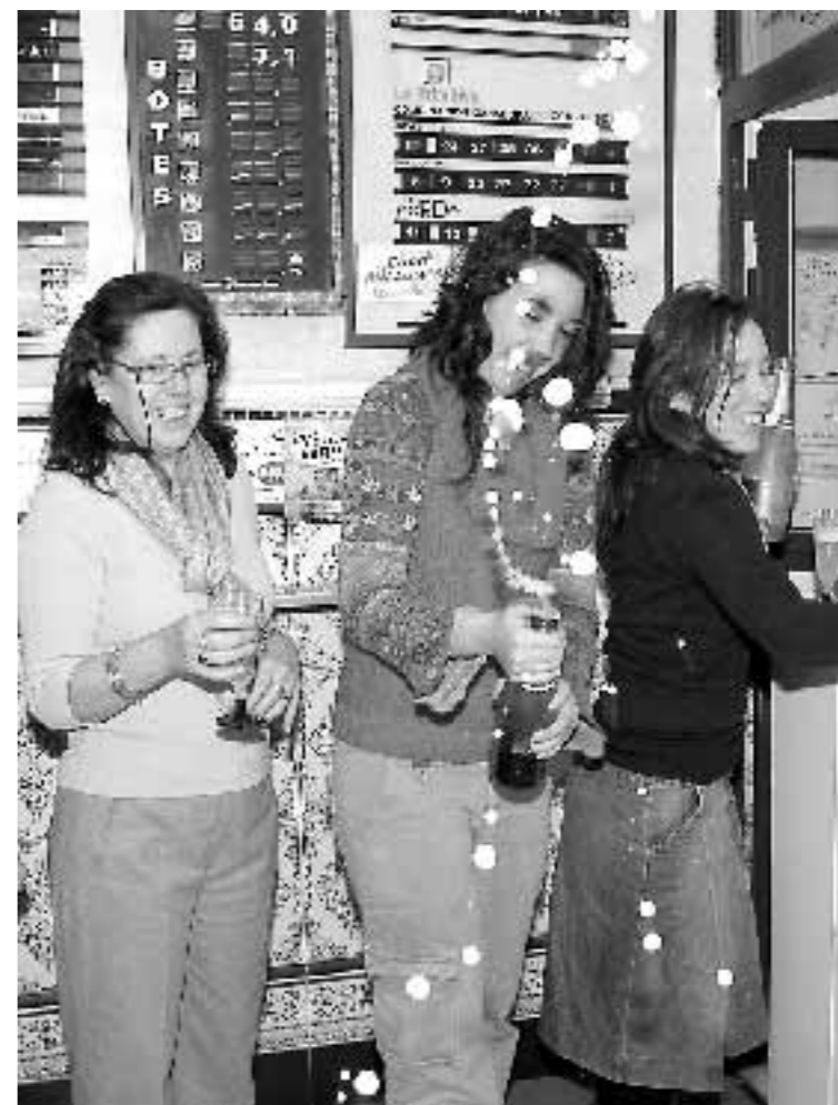
MADRID. La ventura llegó a la capital en forma de quinto.

Cantabria, Castilla-León y Castilla-La Mancha, entre otras. Una de las administraciones agraciadas fue la de La Bruja de Oro de Sort (Girona), el despacho de lotería que más vende en Navidad. Esta vez sólo logró repartir tres series del 25.944, que además fue el único premio principal vendido en este punto de referencia nacional.