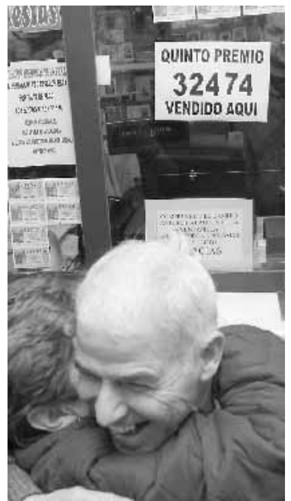
Todos querían felicitar a los premiados.