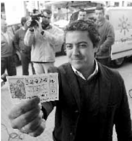
Uno de los agraciados muestra su décimo. / G. HÖHR

Las participaciones vendidas a un euro y medio por la hermandad del Carmen del número 32.474 podrán ser cambiadas por poco menos de 300 euros. Los décimos han sido agraciados con 5.000 euros.