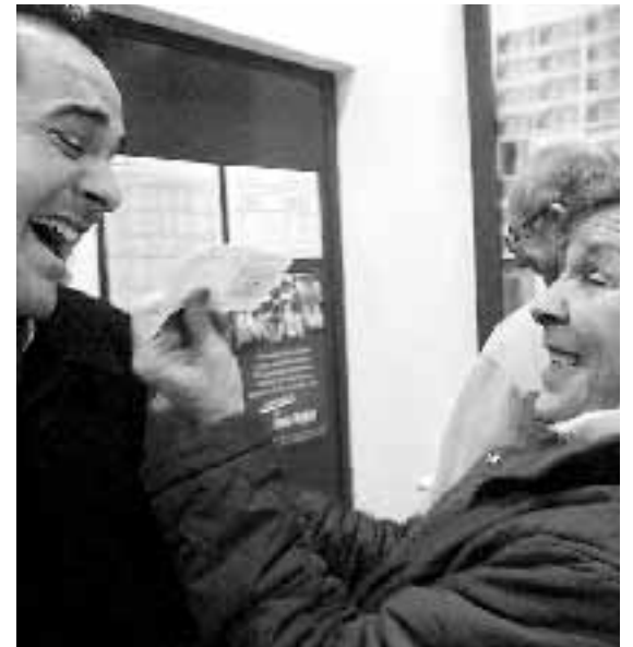
Alegría en la administración número 4.