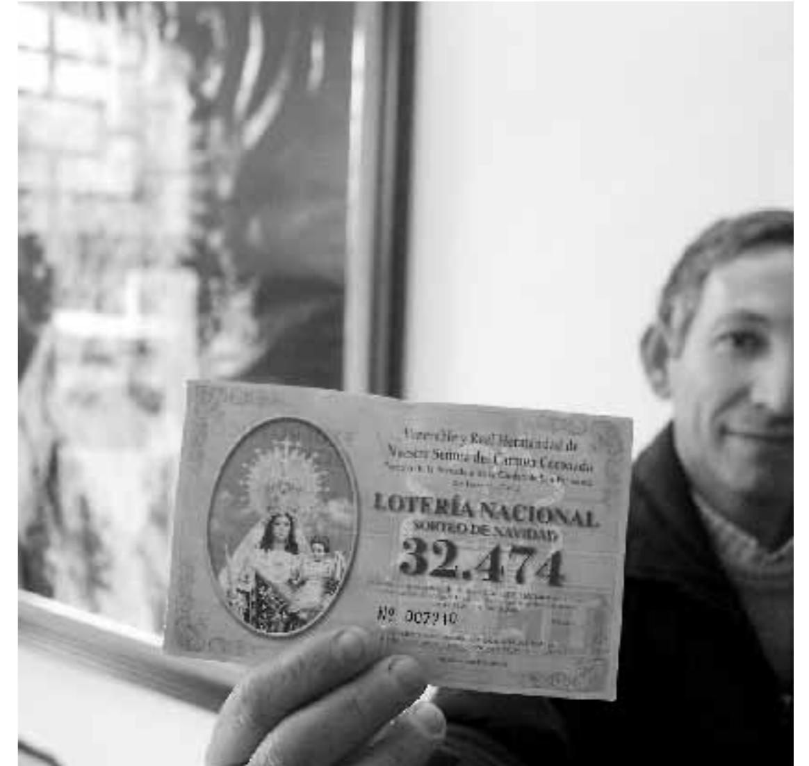
Un agraciado muestra una de las participaciones de la hermandad afortunada.

El reloj no marcaba aún la una de la tarde y ya decenas de personas se agolpaban en las inmediaciones de la calle Luis Milena, uno de los centros neurálgicos de una de las zonas de la ciudad que más ha crecido en los últimos años. Muchos eran curiosos, otros periodistas y algunos sonreían más que el resto. Eran los que habían adquirido uno de los casi 200 décimos dotados con 5.000 euros que Oneto había despachado en su administración en las últimas semanas.