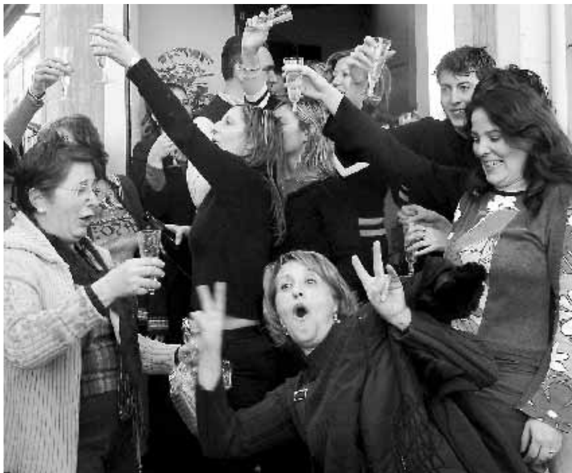
LA SUERTE SE HACE CATALANA. Empleados de Fincas Castellar celebran su tercer premio.

El tercer premio de Mataró se extendió a poblaciones limítrofes, como Cerdanyola, donde el bar Espinal, el Bazar El Regalo o Fincas Castellá vendieron participaciones del 7.494, un número quizás feo pero que será inolvidable.