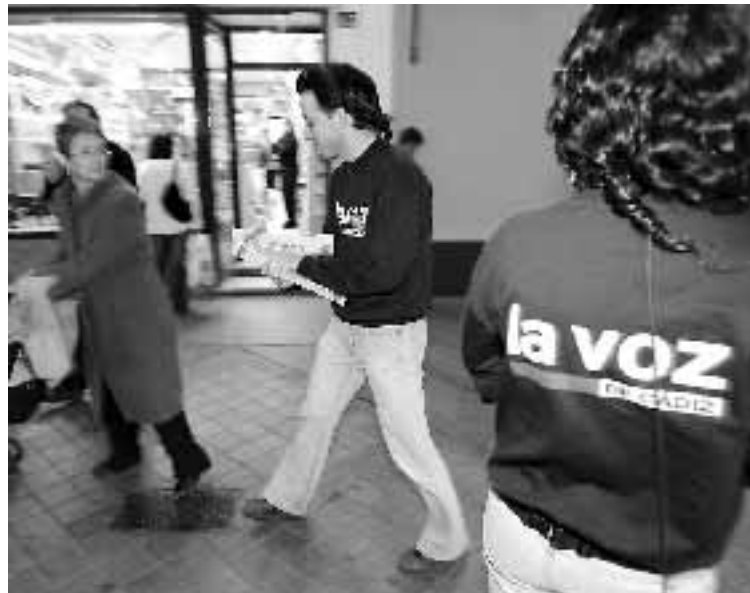
El especial de LA VOZ se repartió en la tarde de ayer.