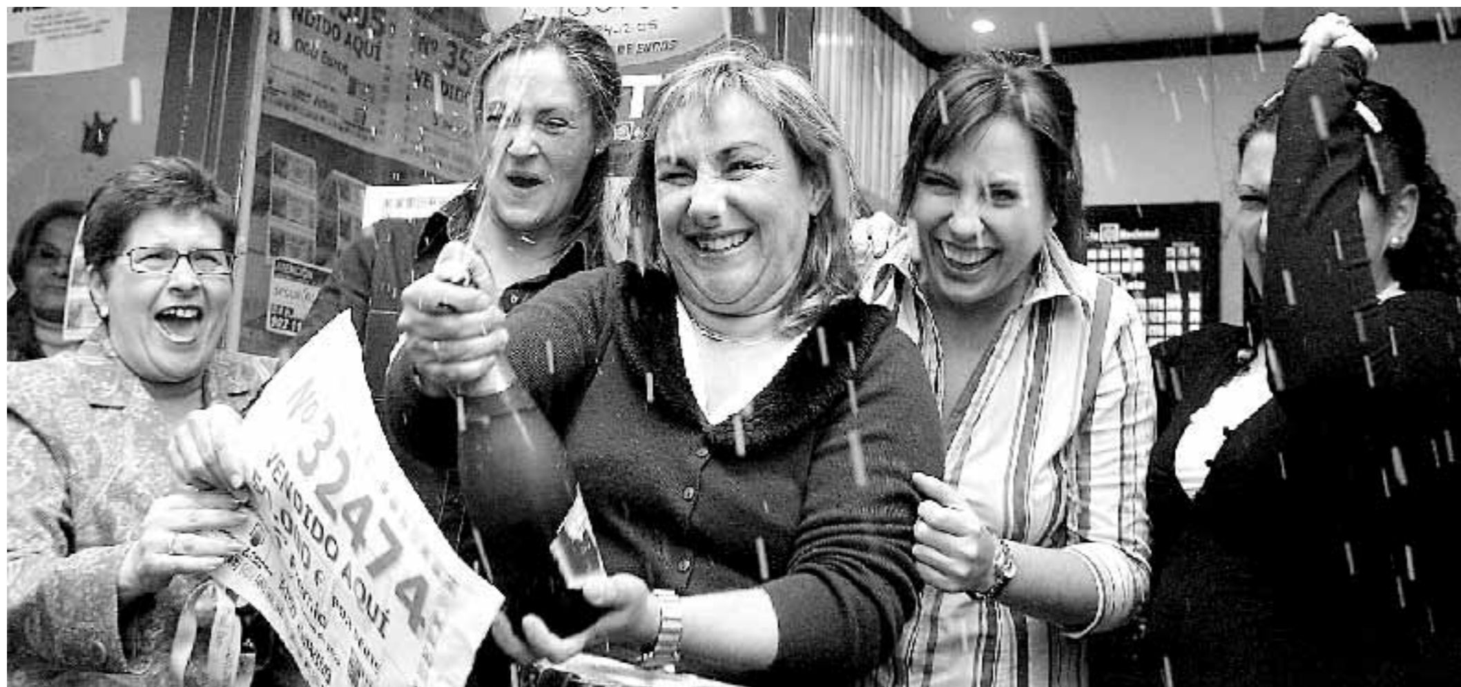
HOGUERA DE SAN NICOLÁS. Miembros de esta asociación festejan con cava el quinto premio comprado en Alicante. / EFE

Cervantes no pudo precisar cuántos décimos ha vendido de las cuarenta series que retiró en Málaga, aunque señaló que devolvió algunas de ellas y que él y su familia se quedaron algunos, por lo que también han sido premiados. Cervantes manifestó que estaba «muy emocionado», y hasta había tenido que tomar una tila, porque no quería morirse «sin dar un premio a su pueblo». / EFE