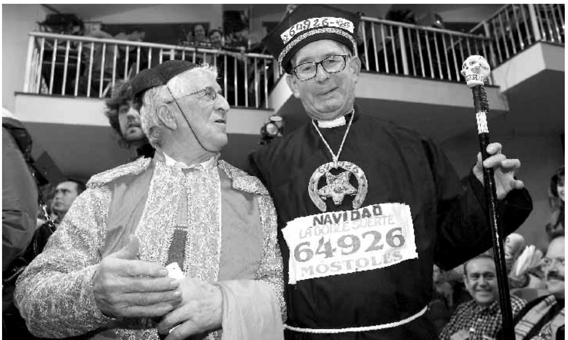
TRADICIÓN FESTIVA. Algunos de los asistentes a la celebración del Sorteo de Navidad acudieron al salón ataviados con pintorescos disfraces.

El aumento en el número de bolas con los premios generó un significativo aumento en el peso de que había de soportar el bombo grande y alargó el sorteo media hora más de lo habitual. Esto obligó a los técnicos a poner un segundo motor de apoyo en el bombo grande, el de los premios, para garantizar la rotación.