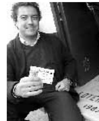
Uno de los premiados.

Los afortunados que portaban el número premiado coincidieron en que el dinero conseguido les garantiza una Navidad más alegres